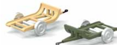
ART. 4012 - Rimorchio Viberti per carro L3 1939