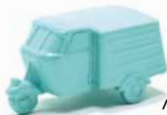
ART. 1032 - Autocarro Fiat 640 N - 1949