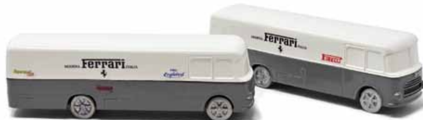
ART. 3018 - Autocarro Fiat 642 RN Carrozzeria Bartoletti - 1952 Scuderia Ferrari