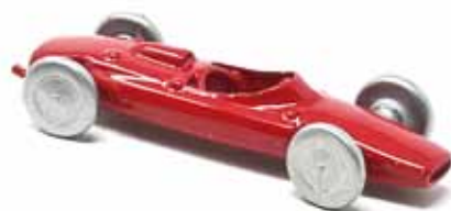
ART. 3010 - Ferrari 156 F2 - 1960 Scuderia Ferrari