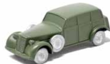
ART. 4009 - Lancia Ardena IV serie 1940