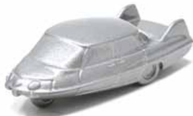
ART. 2017 - Pininfarina PF-X - 1960 (Fiat 1100/103)