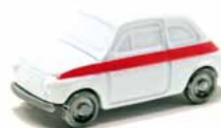
ART. 1012 - Fiat 500 Sport - 1958