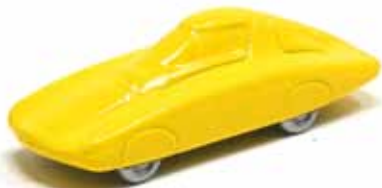
ART. 2016 - Abarth 500 Record Pininfarina (Fiat 500) - 1958