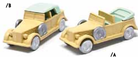
ART. 4005 - Fiat 2800 CMC 1939