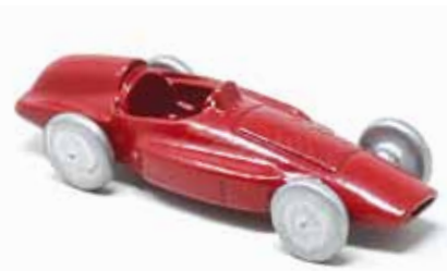
ART. 3013 - Ferrari 555 F1 "Supersqualo" - 1955 Scuderia Ferrari