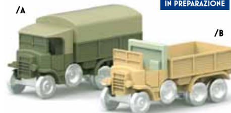
ART. 4011 - Fiat-SPA Dovunque 35 1935