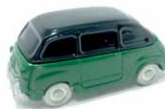
ART. 1010 - Fiat 600 Taxi - 1956