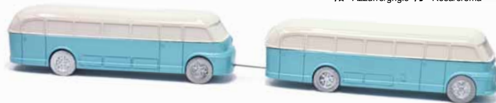
ART. 2024 - Autobus OM Titano Gran Turismo Panoramico Carrozzeria Varesina - 1938

/A - Blu scuro/grigio /B - Rosso scuro/crema