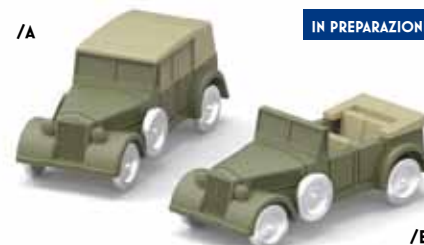
ART. 4013 - Bianchi VM 6C 1939