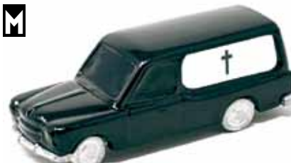
ART. 2040 - Fiat 1400 funebre Carrozzeria Riva - 1950