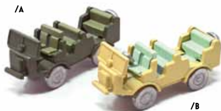
ART. 4002 - Autocarretta OM 36 DM P 1936