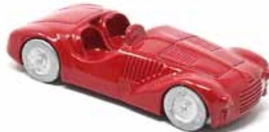
ART. 3011 - Ferrari 125 S - 1947