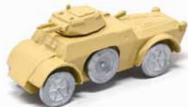
ART. 4006 - Autoblindo Fiat-Ansaldo AB40 1940