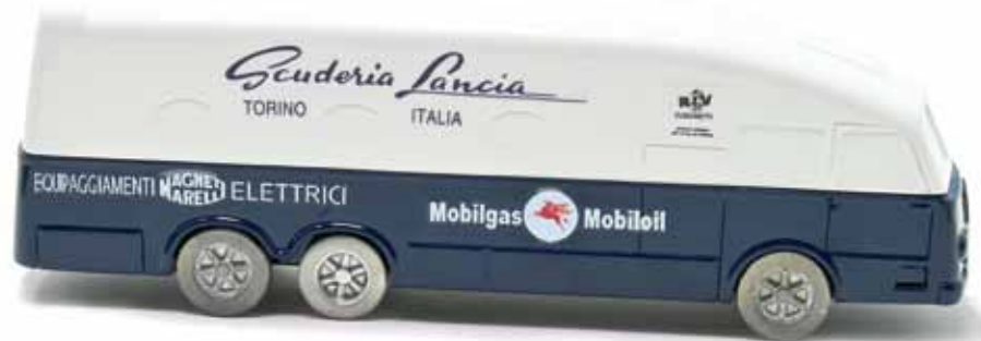
ART. 3005 - Autocarro Lancia Esatau P Carrozzeria Garavini - 1953 Scuderia Lancia