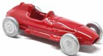
ART. 3008 - Ferrari 801 F1 - 1957 Scuderia Ferrari