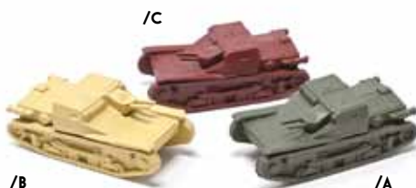
ART. 4004 - Carro veloce Fiat-Ansaldo L3/33 1933