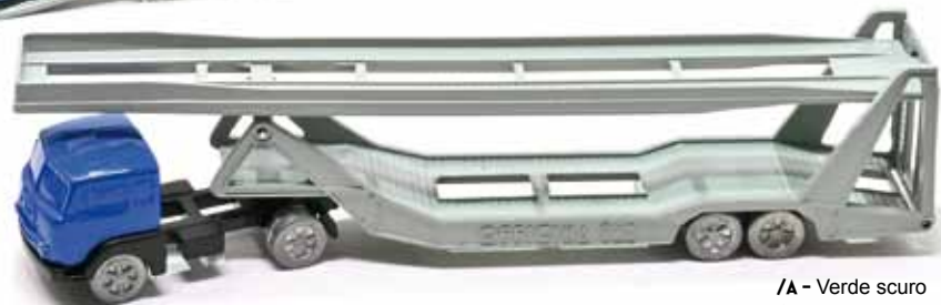
ART. IO14 - Bisarca Fiat 682 T2 - 1955

/A - Verde scuro /B - Azzurro /C - Rosso