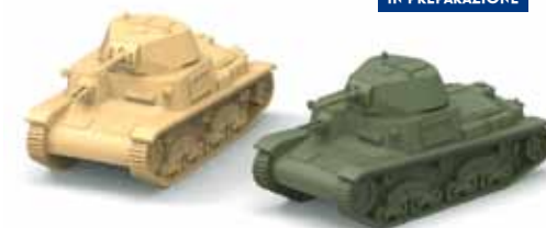
ART. 4014 - Carro Fiat-Ansaldo M13/40 1940