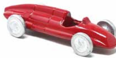
ART. 3016 - Alfa Romeo Tipo 512 GP - 1940 Scuderia Alfa Romeo