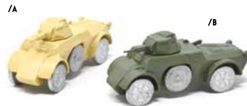
ART. 4007 - Autoblindo Fiat-Ansaldo AB41 1941