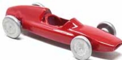
ART. 3009 - Ferrari 246P F1 - 1960 Scuderia Ferrari