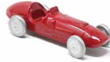
ART. 3017 - Ferrari 375 F1 - 1951 Scuderia Ferrari