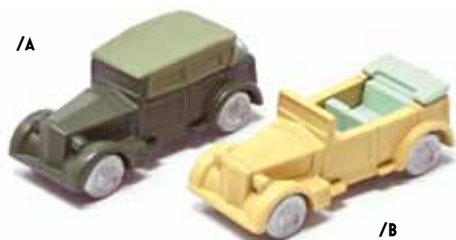
ART. 4001 - Fiat 1100 Torpedo 1939

La Serie 4000 riproduce i mezzi militari impiegati dal Regio Esercito prima e dall'Esercito Nazionale Repubblicano più tardi, nel corso della Seconda Guerra Mondiale. Mezzi d'assalto e tattici, armati o da trasporto, vengono realizzati con i colori dell'epoca e corredati dagli opportuni accessori.