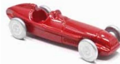
ART. 3003 - Alfa Romeo 159 "Alfetta" - 1950 Scuderia Alfa Romeo