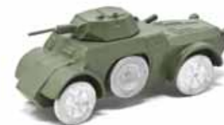
ART. 4008 - Autoblindo Fiat-Ansaldo AB43 1943