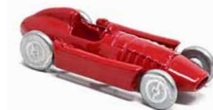
ART. 3004 - Lancia D50 - 1954 Scuderia Lancia