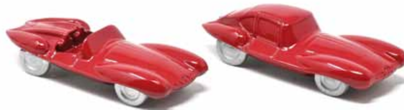
ART. 3019 - Alfa Romeo 1900 C52 "Disco Volante" spider e coupé - 1952