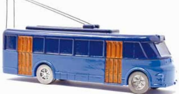
ART. 2027 - Filobus Fiat 668 F - Filovia Torino-Chieri Carrozzeria Viberti - 1951