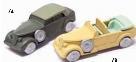
ART. 4003 - Alfa Romeo 6C 2500 CM Torpedo 1941