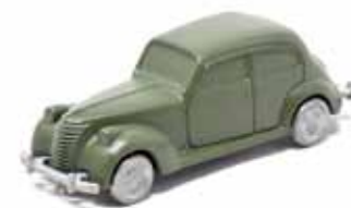
ART. 4010 - Fiat 1500 C 1939