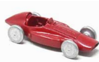
ART. 3012 - Ferrari 553 F1 "Squalo" - 1954 Scuderia Ferrari