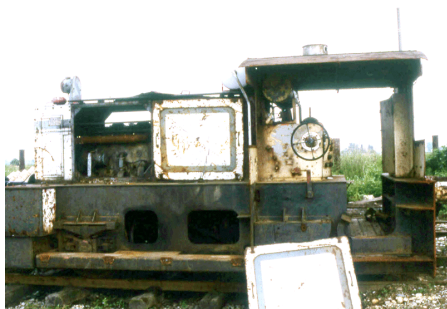
ex 322644-6 Trecate MCF Giugno 1995

Questo mezzo non risultava neanche arrivato in Italia bensì demolito direttamente alla Layritz di Penzberg. E' invece, a quanto sembra, giunto in Italia e con tutta probabilità è stato demolito quasi immediatamente. Questa foto potrebbe essere l'unica testimonianza del suo passaggio in Italia.