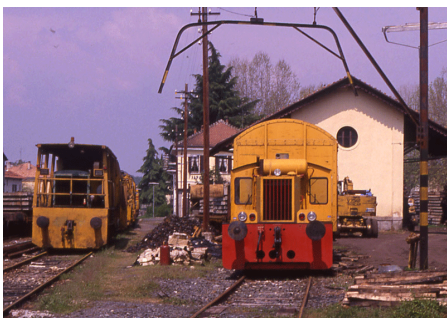
T 3693 a Ghemme per il rifacimento della linea Novara - Varallo Sesia Aprile 1991

T 3693: ex DB 323 815 dal 1985 alla CLF di Bologna (Jung 13183 del 1960)