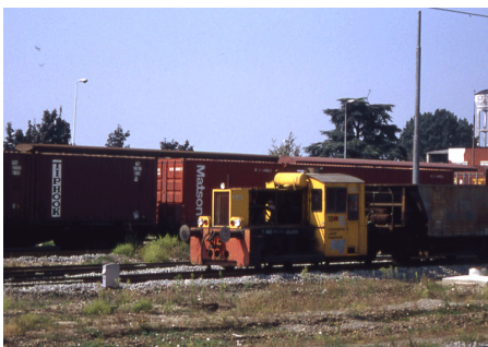
T 3693 CLF 18 Milano Certosa Settembre 1995