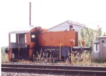
T 3644 Bibbiana Giugno 1994

E' l'unico del terzetto di Kof della ICE di cui non si conosce la matricola. Questa foto lo ritrae nell'ultimo avvistamento conosciuto. Non è da escludere che sia stato addirittura demolito anche se, viste le complesse vicende degli altri due (oggi irriconoscibili rispetto agli anni '90 e con scambi di marcature ripetuti) non lo si può dire con certezza.