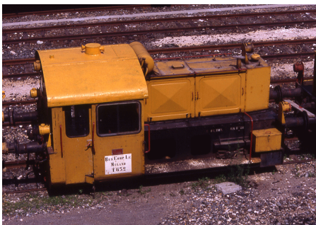
T 632 Domodossola Giugno 1991