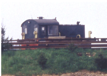
Oleggio Aprile 1996