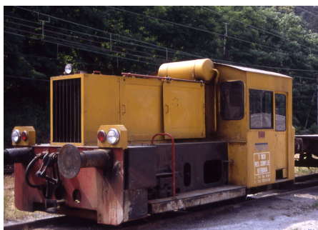
T 1828 Belgirate Luglio 1991