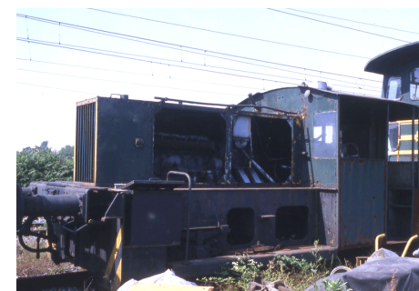
ex 323450-7 Trecate MCF Agosto 2002