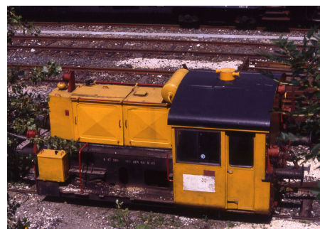
Domodossola Giugno 1991

T 1828 Kof a cabina con sagoma ridotta della ditta PIVATO, matricola d'origine sconosciuta.