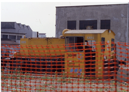
T 3693 CLF 18 Milano Certosa Agosto 1996