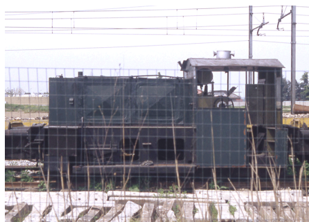
ex 323450-7 Trecate MCF Aprile 1996