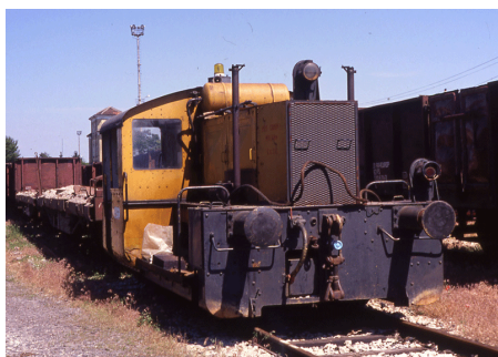
T 656 Voghera Giugno 1991