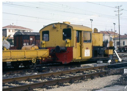
T 632 Gallarate Marzo 1992

T 632: ex DB 323 454 nel periodo in cui era in carico alla Ferredil. Successivamente è stato acquistato dalla SERFER che lo impiega tuttora. Attualmente presso le officine sociali di Udine"