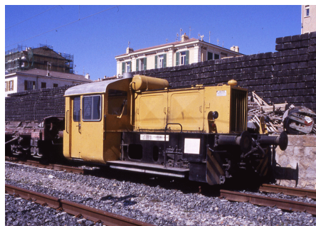
Bordighera Maggio 1995