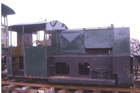
ex 323450-7 Trecate MCF Giugno 1995

Ex DB 323 450 Nel 1980 alla ditta Cariboni e nei primi anni Novanta alla MCF Masfer, probabilmente mai impiegato e rimasto accantonato a Trecate fino alla sua demolizione